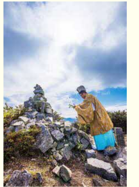
神迎え神事(秋分の日)

琴引山の山頂近くには、出雲大神オオクニヌシ神を祀る琴弾山神社が鎮座し、毎年9月23日前後に例祭が行われています。この例祭の同日、琴引山山頂では、全国の神々が降臨する神在月に先立って、山を清める「神迎え神事」が行われ、多くの参拝者が山頂に集います。