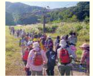
琴引スキー場からの登山道